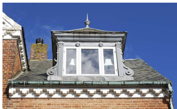
Denne kvist med mange finurlige detaljer sidder på et hus i en helt anden stil end de traditionelle ringkøbinghuse, og det ville være synd at erstatte den med en typisk ringkøbingkvist.