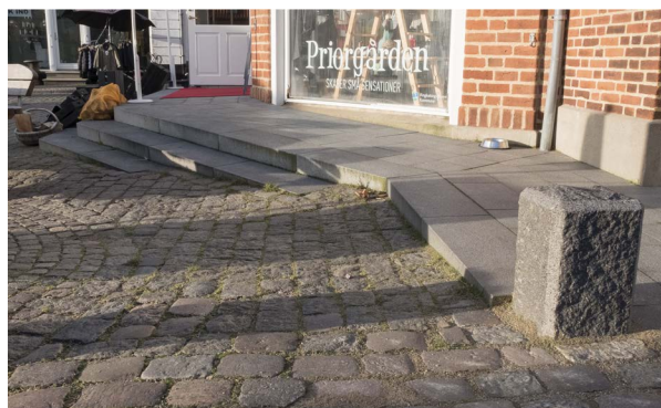
Terrænforskellen ved Priorgården er udlignet med en kombineret rampe og trappe, der er udført i granit som resten af belægningen og giver kørestolsbrugere adgang til butikken.