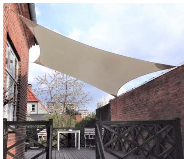
Overdækning af terrasse med løst solsejl, der er monteret med fire kroge fastgjort i murværket. Når solsejlet er taget ned vil kun krogene være synlige.