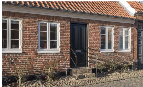
Smukt og harmonisk indgangsparti i Vestergade. Den gamle granittrappe vidner om mange års slid og de diskrete håndlister forstyrrer ikke helhedsindtrykket.

Ansøgning. Der skal altid ansøges om tilladelse til ændring eller etablering af trapper, ramper, håndlister og postkasser. Kontakt eventuelt kommunen for en forhåndsdialog.