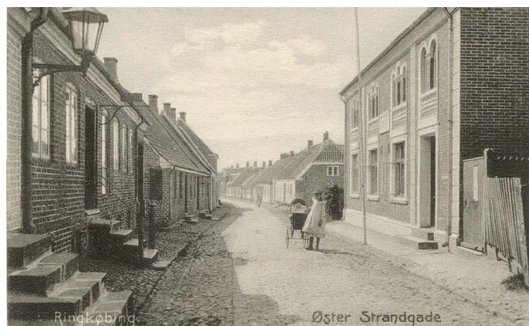
På dette gamle postkort fra Øster Strandgade er der endnu ingen kviste på de smukke, ubrudte tagflader.

Ansøgning. Der skal altid ansøges om tilladelse til ændring eller etablering af kviste. Ansøgningen skal være bilagt målfaste tegninger, og vise kvistenes tilpasning til husets arkitektur. Kontakt eventuelt kommunen for en forhåndsdialog.