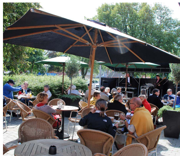
Når solen skinner om sommeren er restauranternes udearealer domineret af parasoller, men som andet løst inventar kan de fjernes, når de ikke er i brug.