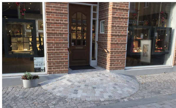
Terrænforskellen ved denne butik i Nygade er udlignet med en halvrand rampe i chaussesten som gadens øvrige belægning, og de diskrete håndlister i træ giver støtte ved butkisdøren.