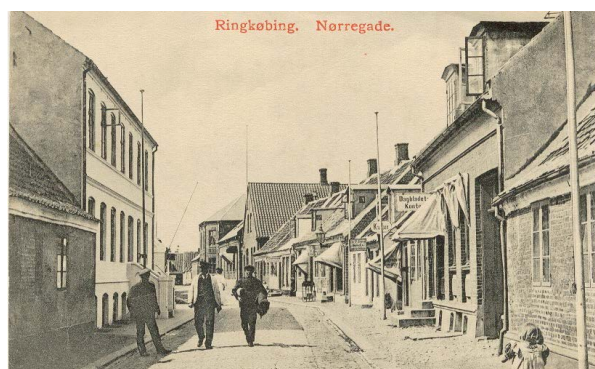
Op gennem 1900-tallet kom der kviste på tagene, og kvistene på postkortet fra Nørregade er typiske for Ringkøbing. Flere af dem har et lille vindue, så man kan kigge hen ad gaden.