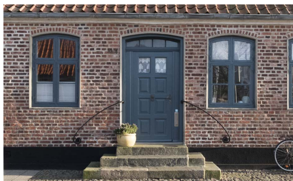
Håndlisterne ved denne flotte granittrappe i Vester Strandgade er mere markante, men flotte med de snoede ender, og kun den blanke brevsprække forstyrrer det harmoniske indtryk.