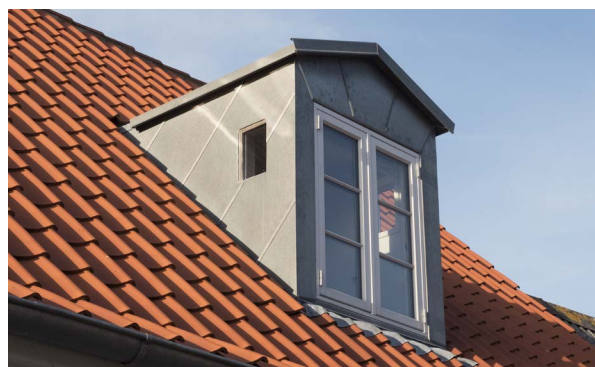
Moderne udgave af en typisk ringkøbingkvist med zink på tag, front og flunker og med et lille, rektangulært vindue. De fleste nyere kviste i Ringkøbing er variationer af denne type.